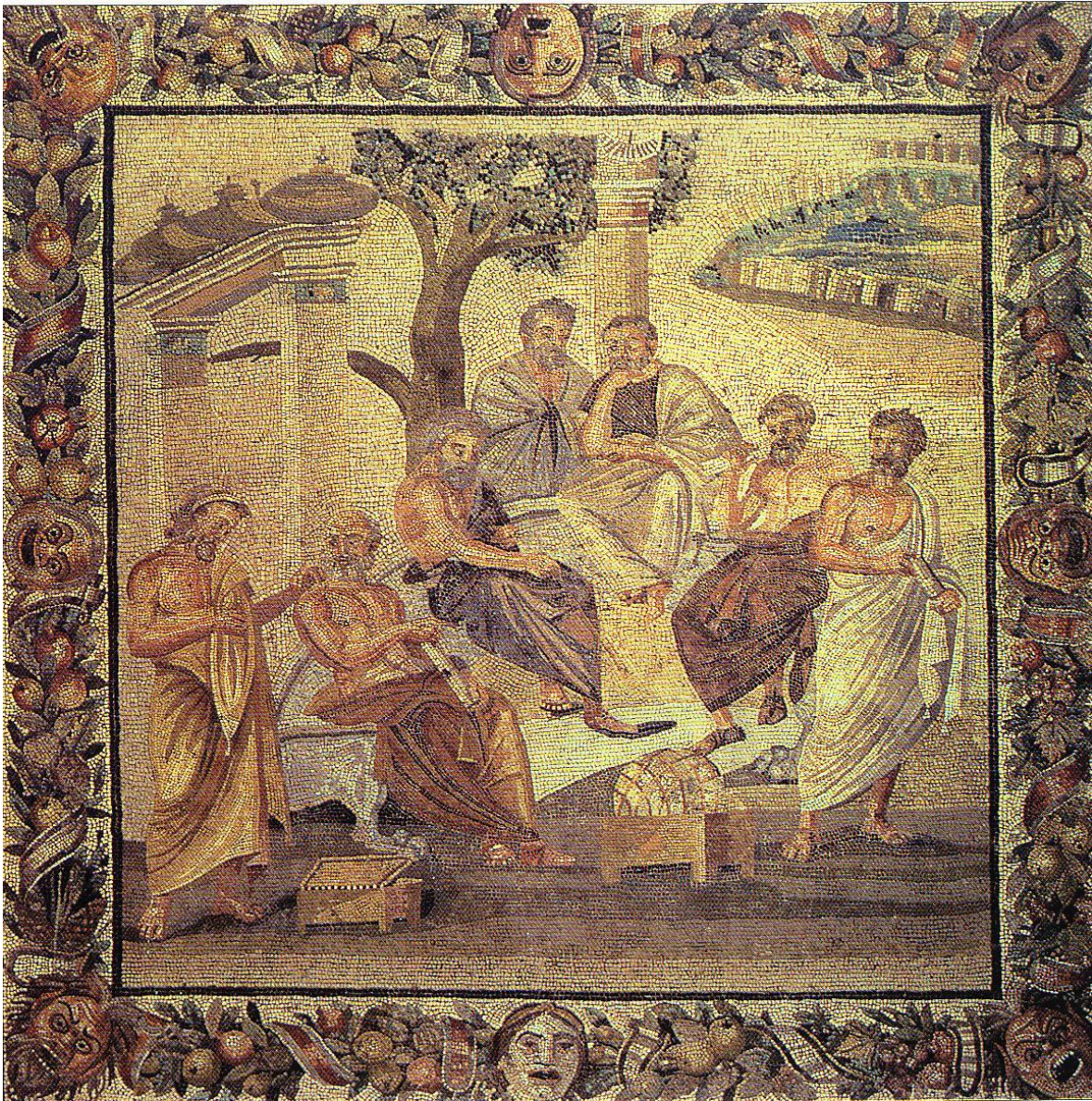
Mosaico romano del siglo II a.C. que representa la Academia de Platón en las afueras de Atenas. Museo Arqueológico de Nápoles, Italia.