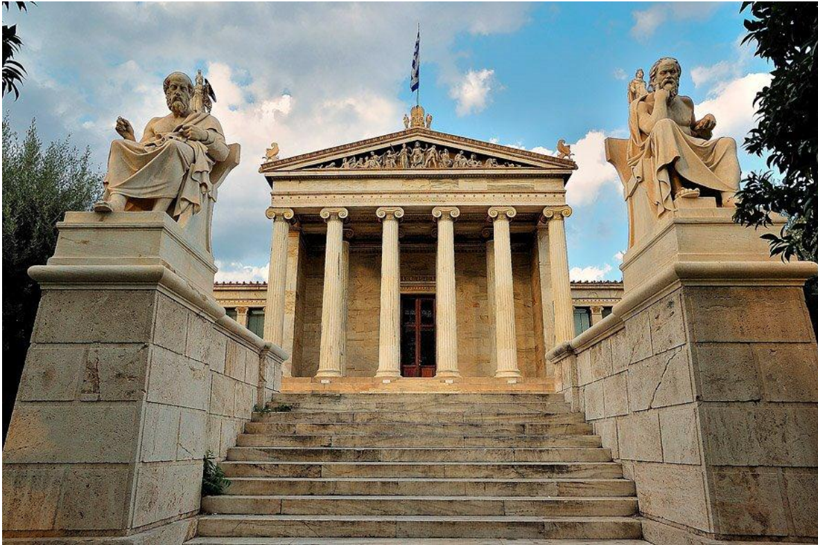
Edificio de la nueva Academia platónica en Atenas, Grecia.