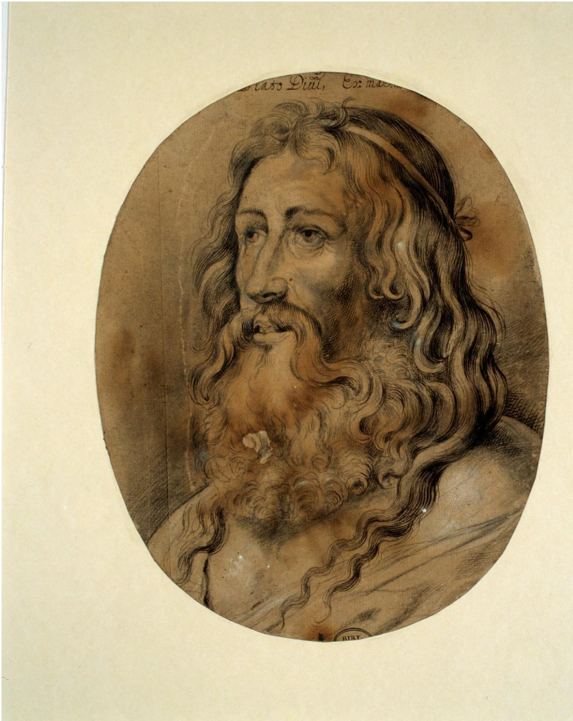
Retrato de Platón, grabado por Pedro Pablo Rubens, inspirado en la escultura hecha por Silanión en la antigüedad. Museo de Arte, Universidad de Gottingen.