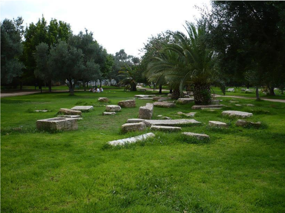
Ruinas de la antigua Academia de Platón en Atenas, en el actual barrio de Kolonos.